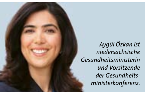
Aygül Özkan ist niedersächsische Gesundheitsministerin und Vorsitzende der Gesundheitsministerkonferenz.