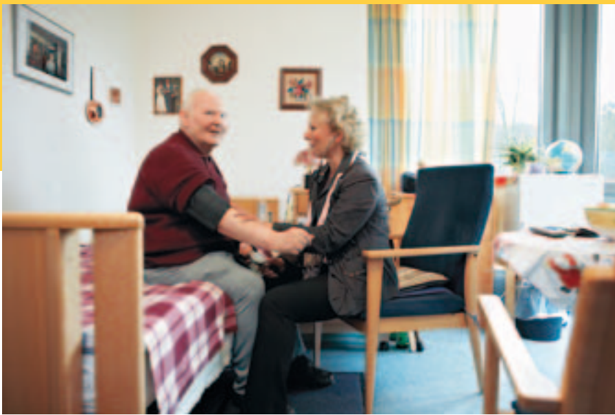
Gute Versorgung in vertrauter Umgebung – das Feierabendhaus in Witten nimmt am Projekt der Integrierten Versorgung teil.