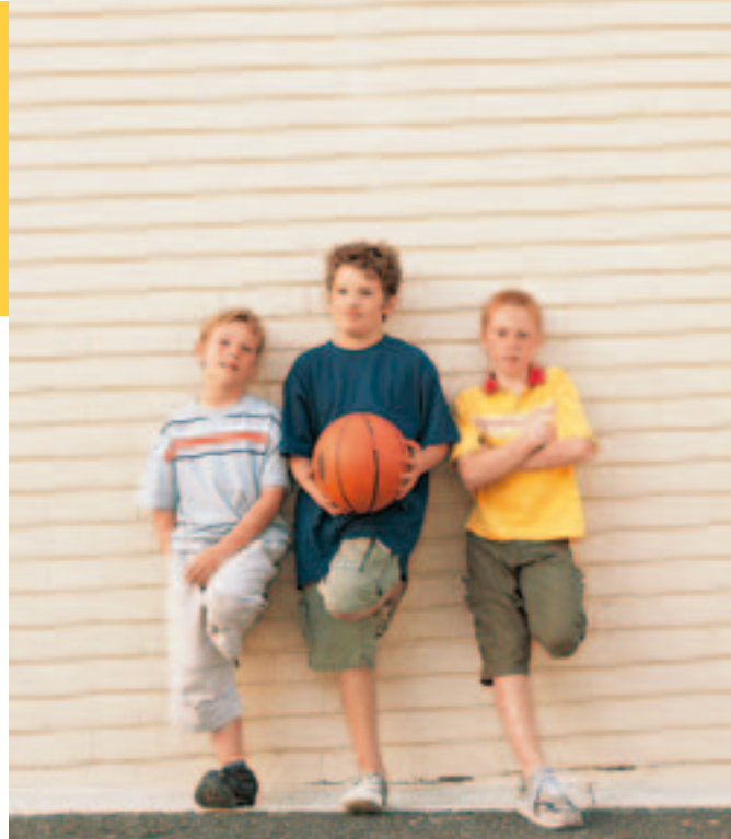
Gesund aufwachsen – Sport mit Freunden gehört dazu.

Insbesondere das Engagement für die Prävention im Lebensumfeld der Menschen (sogenannter Setting-Ansatz) steigerten die Kassen noch einmal deutlich. Kinder und Jugendliche aus allen sozialen Schichten lassen sich durch diese gesundheitsfördernden Maßnahmen am besten erreichen – davon profitieren vor allem Kinder mit sozialen Benachteiligungen. Insbesondere die AOK hat ihre Aktivitäten in Kindergärten, Schulen und Stadtteilen gegenüber dem Vorjahr mit einem Plus von acht Prozent noch einmal deutlich ausgeweitet. Sie fördert mit einem Anteil von 47,6 Prozent knapp die Hälfte aller Projekte im Settingbereich und ist damit Vorreiter in diesem wichtigen Bereich der Gesundheitsvorbeugung.